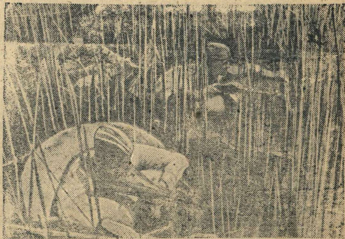
Действующая Армия (В плавнях Бубани)

Немецко-фашистские людоеды истребляют мирное население временно оккупированных ими советских районов. В селении Копище, Житомирской области, гитлеровцы широко оповестили крестьян о том, что 13 июля будет производиться продажа соли и спичек. Ничего не подозревавшие жители, главным образом старики и женщины, большой толпой собрались у лавки. Немцы открыли из автоматов огонь по собравшимся. От руки фашистских палачей погибло много ни в чем не повинных мирных советских людей.