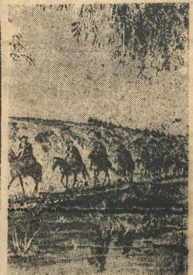
Весь Союз знает славных казаков 4-го гвардейского казачьего Кубанского кавалерийского корпуса генерал — лейтенанта Н.Я. Кириченко.

Несколько партизанских отрядов, действующих в Лехицградской области, за две недели пустили под откос 21 воинский эшелон противника. Разбито 14 паровозов и свыше 150 вагонов с войсками и военными грузами.