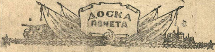
Решением исполкома райсовета и бюро РК ВКП(б) за образцовую работу на уборке урожая на районную Доску почета заносится:

Дирекции, партийной организации, всему коллективу МТС надо в несколько раз улучшить свою работу на уборке хлебов. Машинно-тракторная станция должна сделать все, чтобы колхозы района успешно убрали урожай.