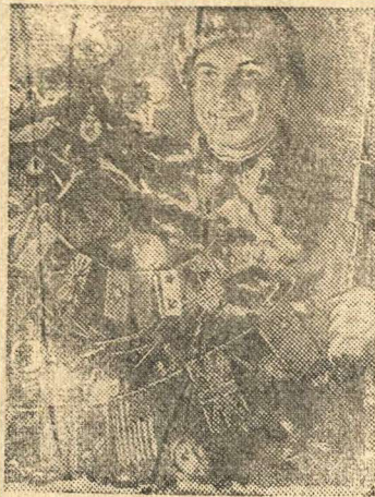
Плакат работы художника А. Вокорекяна (издательство «Искусство»).