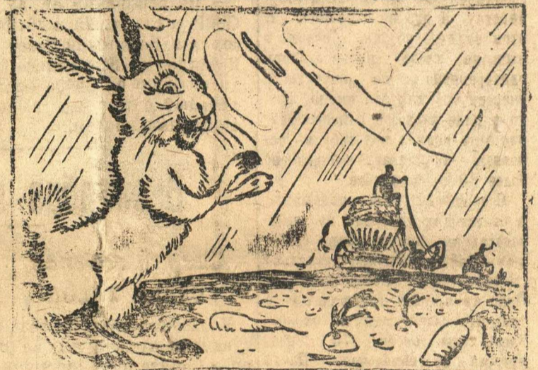
Заяц. Половину урожая в поле оставили.