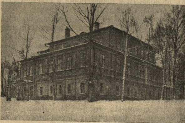
Дом № 15 (б. Киржбаум) по Мартыновской ул., в котором жил в период 1902—1905 г.г. М. Горький.

20 (7) ноября 1901 г. нижегородские революционеры провожали Горького открытой уличной демонстрацией при отъезде в Ялту. Пели революционные песни и разбрасывали прокламации. По возвращении с юга, в 1902 г., он был выслан на жительство в Арзамасский уезд, под надзор полиции (см. «Воспоминания»), а потом в конце года снова вернулся в Н.-Новгород (д. Киржбаума, на Мартыновской ул., № 15, против дет. дома), где у него часто бывали писатели Л. Андреев, Е. Чириков, С. Петров-Скиталец, артист Шаляпин и др.