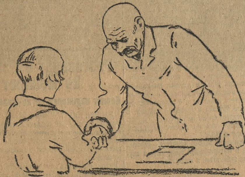
«Пионеры знают и любят вас, Алексей Максимович».