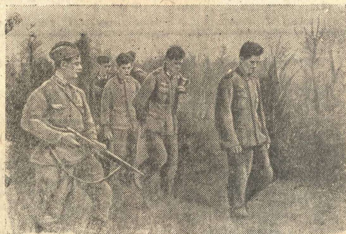
Группа гитлеровцев, захваченных в плен, направляется в тыл.