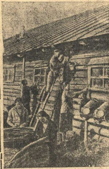
На снимке: Животноводческая бригада колхоза имени 8 марта (Котомский район, Ивановская область) заканчивает ремонт скотного двора.