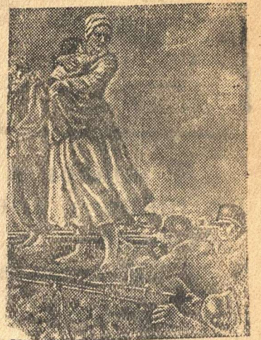
На снимке: «Варварство немецких оккупантов» — картина работы художника И. Томдче.