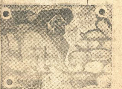
Колхозник доблестный, отец Зерном обильно фронт снабжает. Сын старика герой — боец! В боях врагов уничтожает. Зерно на фронте со свинцом соединил в подвиге едином!