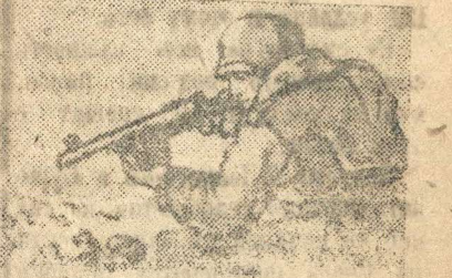
Гордится сын родным отцом. Отец гордится славным сыном. Страна обоими горда — Героем сельского труда И фронтовым бойцом-героем — И воздаст им честь обоим! — Привет отцам и сыновьям! Вперед — к решающим боям!

Одно ТАСС № 692. Рисунок худ. В. Айвазьян. Текст Демьяна Бедного