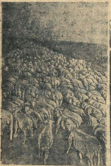
На снимке: Стадо овец возвращается на родину (Ростовская область).

Восстанавливается животноводство в освобожденных районах страны