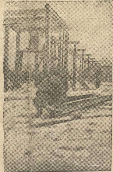
Строительство подвесной дороги.

В колхозе «Красная заря» Лебединского района, Сумской области (УССР) построено навозохранилище на 300 тонн навоза. Сейчас колхозники заканчивают строительство подвесной дороги для вывозки навоза с фермы к навозохранилищу.