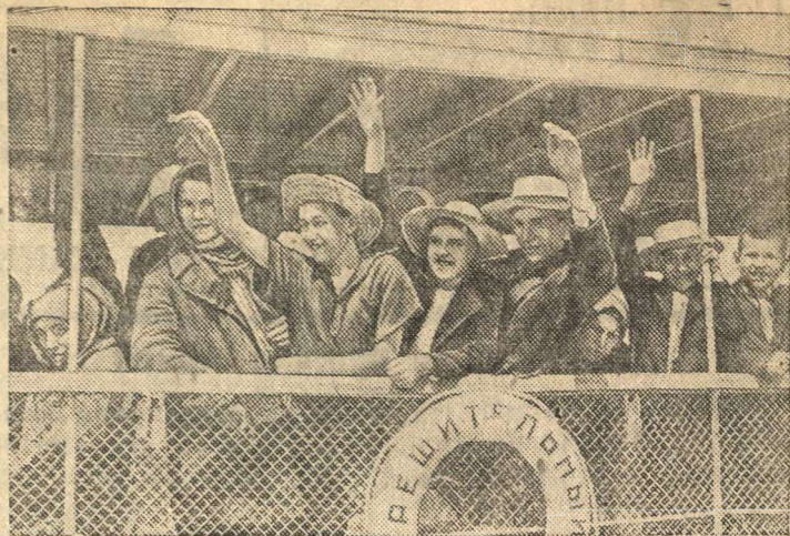
Учащиеся школ города Энгельса (АССР Немцев Поволжья) отъезжают в колхозы и совхозы республики помогать убрать обильный урожай.