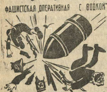
Рисунок В. Н. Горяева. (Овно ТАСС № 12). Фотохроника ТАСС.