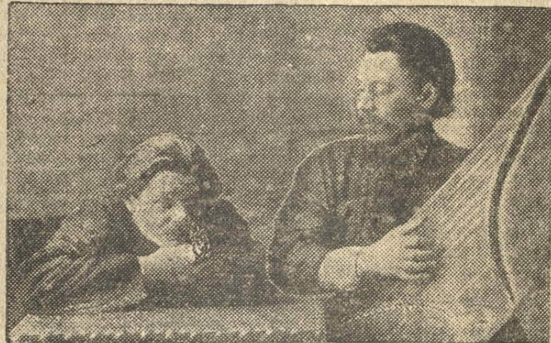
Максим Горький и Скиталец во время их пребывания в Нижнем-Новгороде.

Широкими, сочными мазками писатель рисует в ней картины низов жизни. Быт церковных певчих. Жуткие картины людских страданий и унижений в обстановке проклятого прошлого.