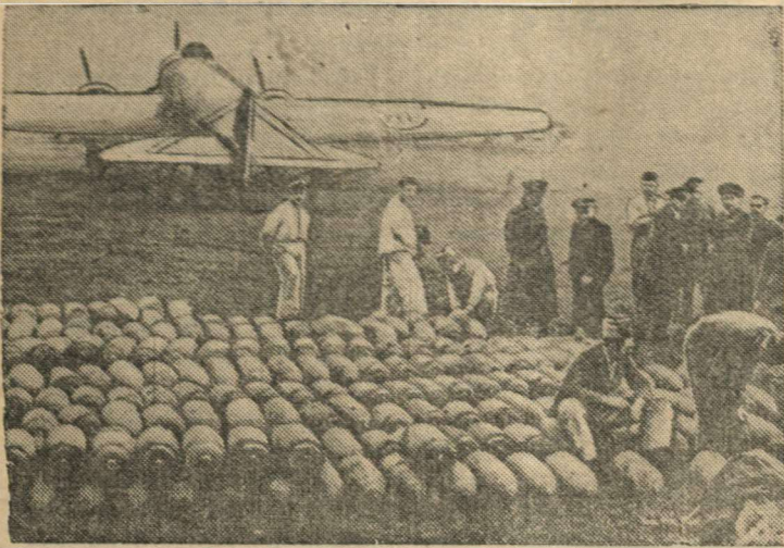
Итальянская авиационная база в Албании.