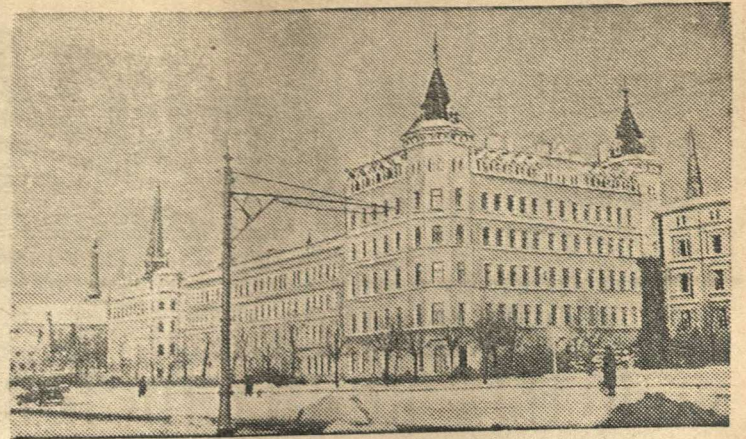
Набережная Западной Двины в Риге (Латвийская ССР).