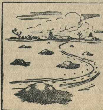
Как не надо складывать навоз в поле.

Практика прошлых лет показала, что в тех колхозах, которые не сумели организовать вывозку основной массы навоза в зимний период, огромное количество его оставалось совершенно неиспользованным. В Сибири, юго-восточных, южных и центральных областях Союза почти в каждом районе имеются залежи в десятки и тысячи тонн старого перегноя. Это ценное удобрение необходимо теперь вывезти полностью на колхозные поля.