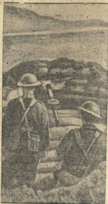
Пулеметное гнездо на одной из дорог в Англии.