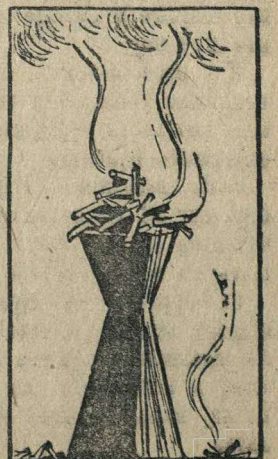
и их продукция