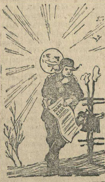
Солнце подводит. — Все бы хорошо, да вот солнце торопится, выведет из графика!