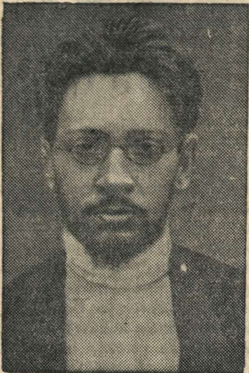
На снимке: Я. М. Свердлов в ссылке (1910 год).

Сегодня исполняется 20 лет со дня смерти верного соратника Ленина и Сталина, одного из лучших организаторов и руководителей нашей партии и Советской власти, председателя ВЦИК — Якова Михайловича Свердлова.