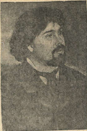
К 25-летию со дня смерти (19 марта 1916 г.) знаменитого русского художника В. И. Сурикова. В. И. Суриков (с портрета художника И. Е. Репина, 1887 г.).