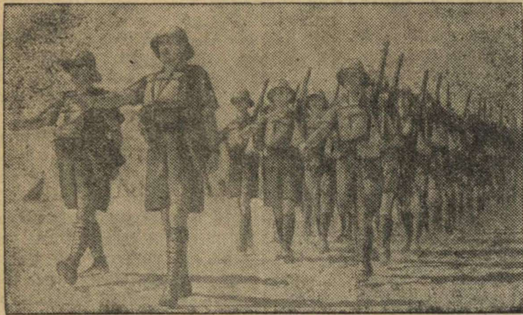
Английские войска на фронте в Западной пустыне (Африка).