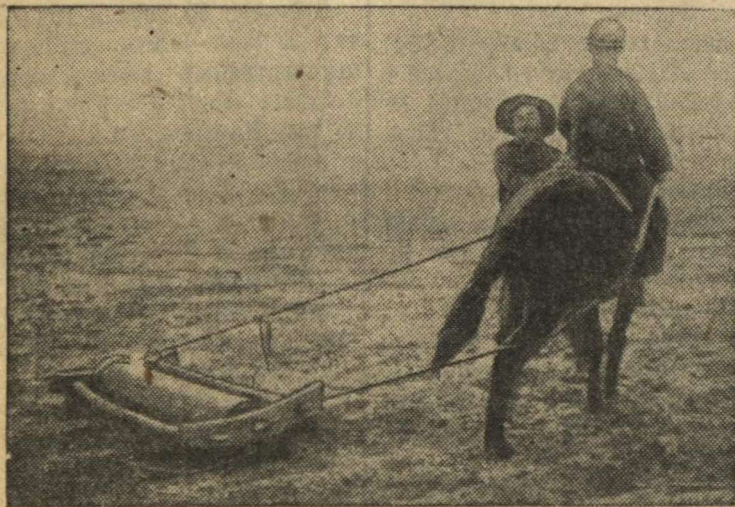
Манчжурский крестьянин на весенних полевых работах.

Рузвельт отметил, что США отправляют в Югославию военные материалы с максимальной быстротой. (ТАСС).