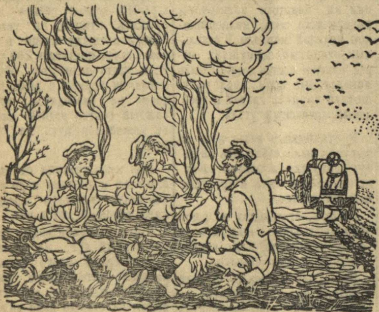
Много дыму, да мало пылу.