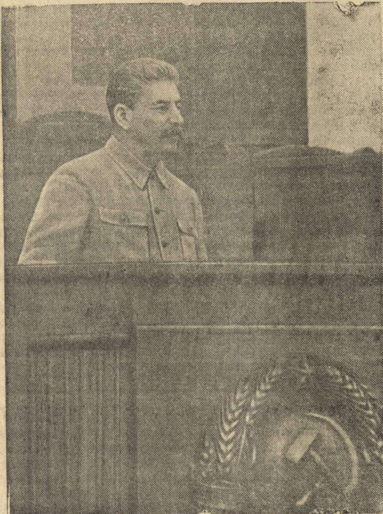
Выступление товарища И. В. Сталина на торжественном собрании, посвященном выпуску командиров, окончивших военные академии, состоявшемся в Большом Кремлевском дворце 5-го мая 1941 года.

XI ГОД ИЗДАНИЯ АДРЕС РЕДАКЦИИ: Красные-Баки, Горьковской области, Интернациональная, 1 Телефоны: отв. ред. № 74, общий № 94.