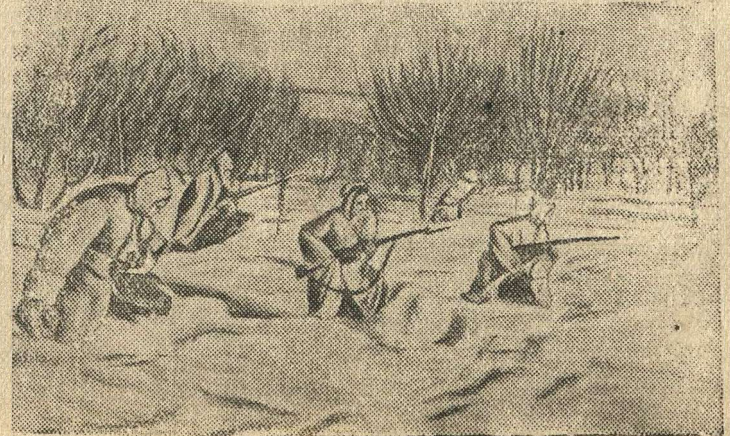
Бойцы подразделения капитана М. Яценко наступают на населенный пункт Н.