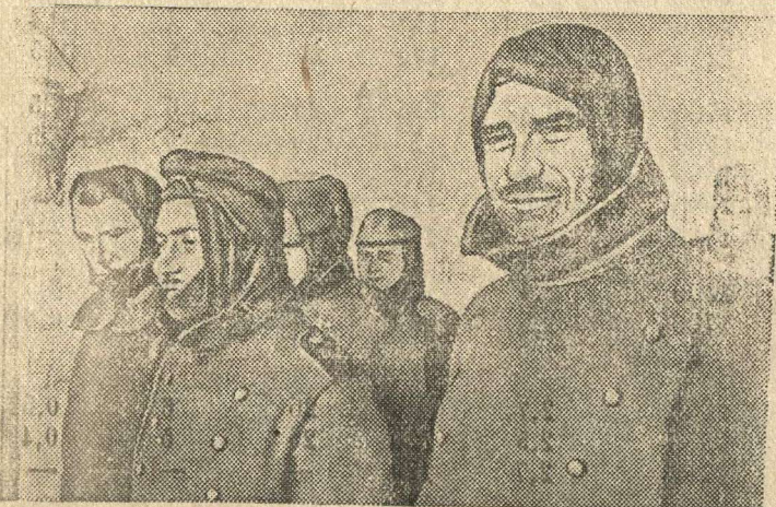
Пленные гитлеровские воины.