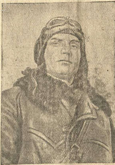
Герой Советского Союза батальонный комиссар