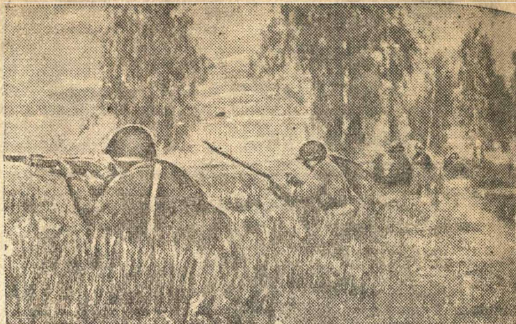
Бойцы ведут огонь по вражеским огневым точкам. (Галр из Совкиножурнала).