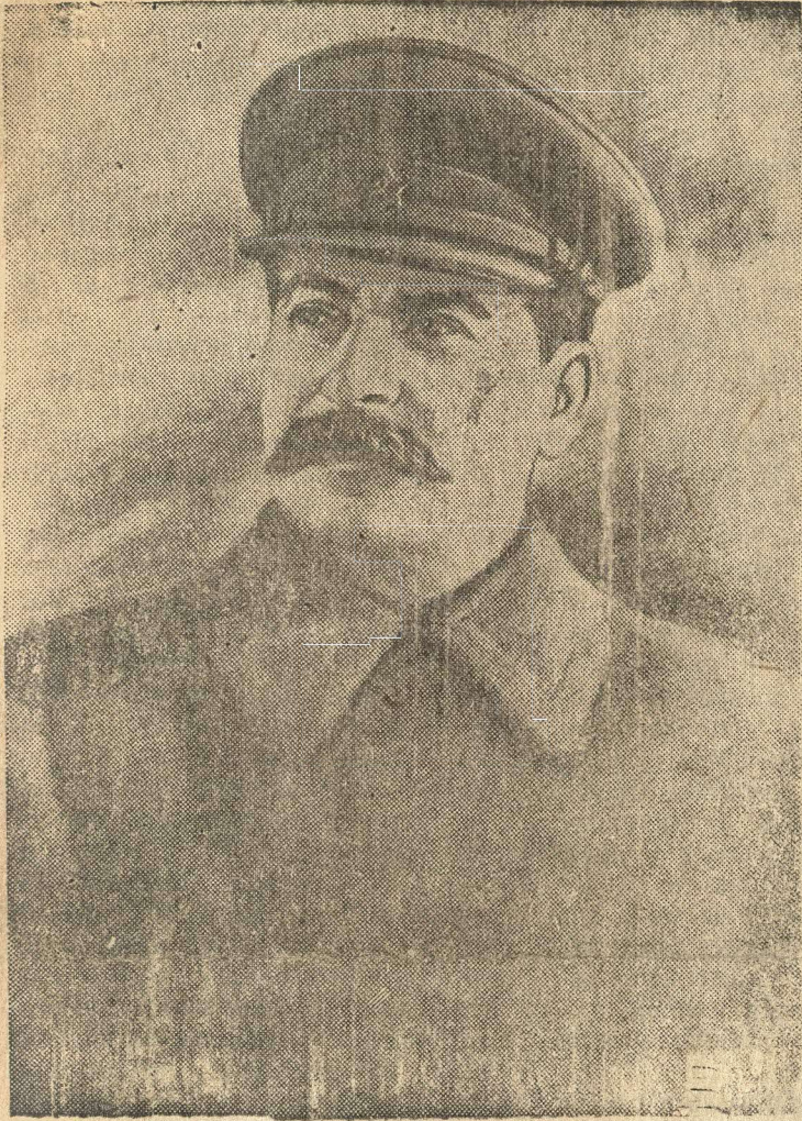
И. В. СТАЛИН.