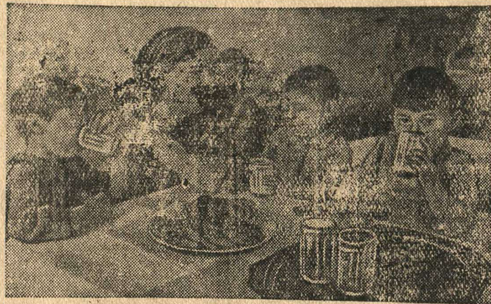
На снимке: в освободженном от гитлеровцев г. Старице (Калининская область). Дети фронтовиков в своем детском саду за завтраком.

Почин федякинцев широко подхвачен всей страной.