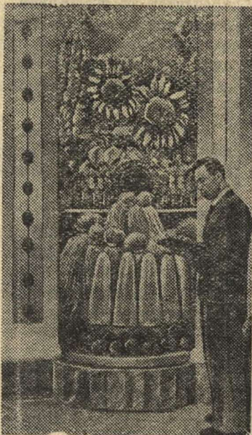
Стэнд технических культур в ввводном зале павильона «Сибирь».

На Всесоюзной сельскохозяйственной выставке.