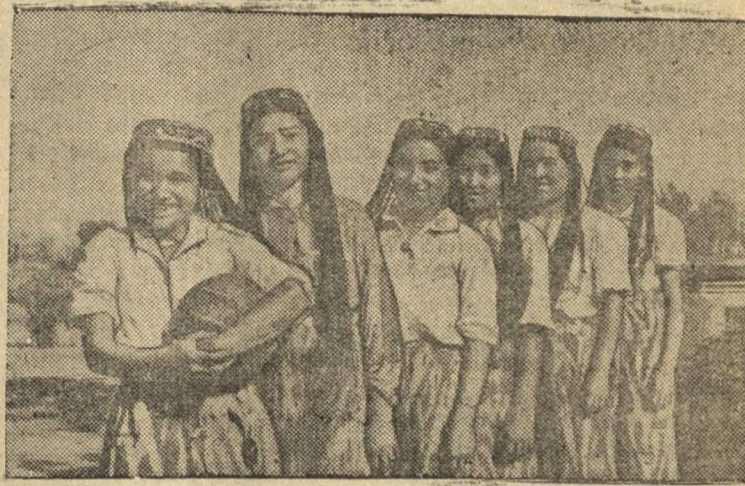
Женская волейбольная команда колхоза.

Колхоз имени Буденного Избаскентского района, Андижанской области, Узбекской ССР — участник Всесоюзной сельскохозяйственной выставки 1941 г. по физкультурной работе.