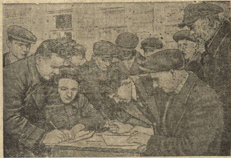
Подписка на Заем Третьей Пятилетки (выпуск четвертого года) в колхозе имени Горького (Ленинский район, Московская область)

Дружно подписались на новый заем рабочие по выработке кадров Красно-Варовской артели инвалидов «Коммунар». Среди них нет ни одного, который бы своей подпиской не участвовал в реализации займа.