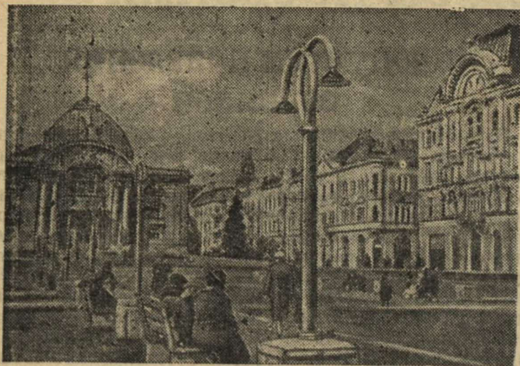
Театральная площадь в г. Черновцах. Слева—Украинский драматический театр, справа—Дворец юных пионеров. Фото А. Зяцина. Фотохроника ТАСС.