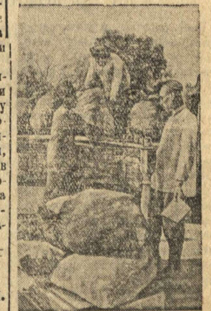
Отгрузка картофеля нового урожая для сдачи государству.

В ответ на наглое нападение фашистских захватчиков колхозники сельхозартели им. Калининна (ауд. Геокча, Ашхабадский район) досрочно выполняют поставки государству.