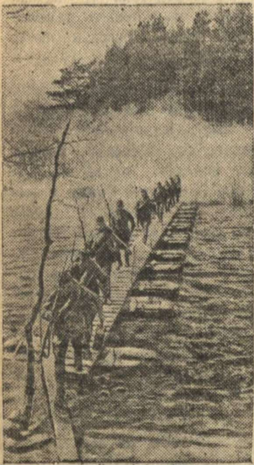
Форсирование водной преграды.

заразавшего врага, несет в колхозный амбар свое льноволокно, полученное в прошлом году на трудодни. И к утру пятого июля такого волокна было принято два с половиной центнера, а колхозники все продолжают приносить новые и новые партии льна.