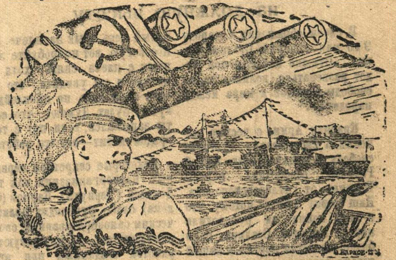
22 июля 1945 года ДЕНЬ ВОЕННО-МОРСКОГО ФЛОТА СОЮЗА ССР

За первое полугодие на значек ГТО 1 ступени в районе сдали 377 юношей и девушек. На значек БГТО сдали 167 чел.