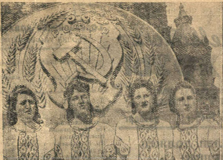
Всесоюзный парад физкультурников на Красной площади в Москве 12 августа 1945 г. На снимке: физкультурница РСФСР.