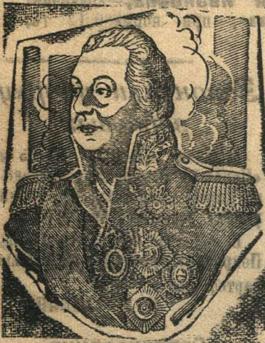
Великий русский полководец М. И. КУТУЗОВ.

Смешались в кучу кони, люди, И залпы тысячи орудий Слились в протяжный вой!..