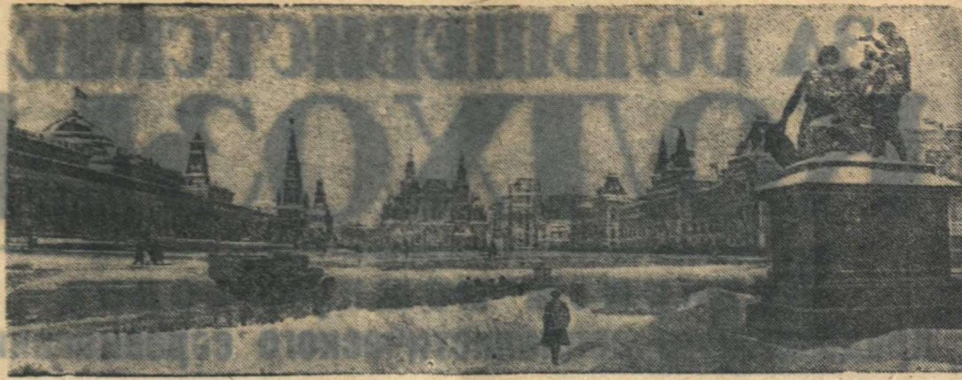
КРАСНАЯ ПЛОЩАДЬ (МОСКВА)