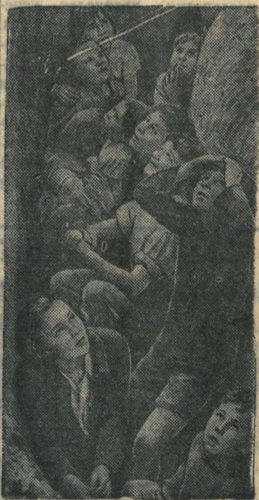
Английские дети наблюдают из убежищ за воздушным боем немецких и английских самолетов.

«В Париже нечего есть...» — пишет газета «Жур-Эко де Пари». — Но самое страшное — это наличие огромного количества молодых людей, которые из-за голода совершают нападения и кражи».