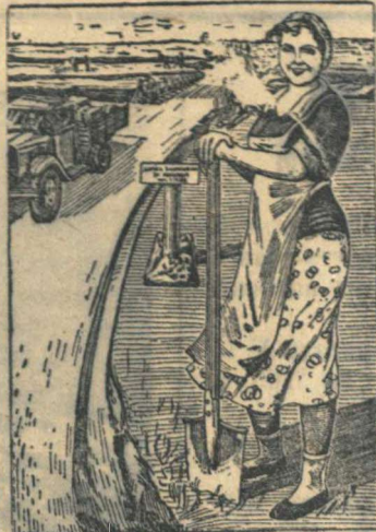
КОЛХОЗНАЯ ВОРОНКА БРИГАДА ПЕРВАЯ БОИНА ЧАСТИ СЕЛЬСКОГО НАСЕЛЕНИЯ В СТРОИТЕЛЬСТВЕ И РЕМОНТЕ ДОРОГ

Народные стройки нанесли сокрушающий удар по старым, отжившим методам работы, они доказали государственную целесообразность объединения народных сил на строительстве трактов и магистралей, связывающих между собой не только села, но и многие районы и города. Народные стройки вочью убеждают, что для окончательной ликвидации бездорожья не требуется больших государст-