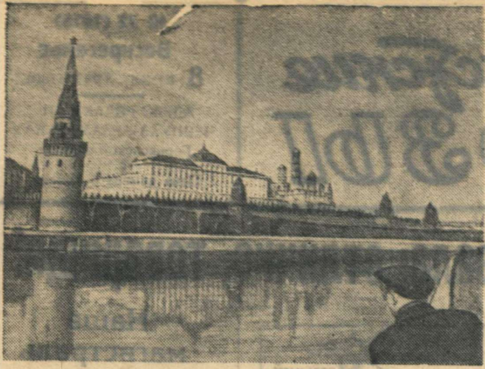
Вид на Кремль с Большого Каменного моста (Москва).

размером 10 на 10 аршин. Поселок Сережа, рядом с военкоматом, Мухин В. С.