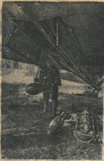
Перед боевым вылетом.