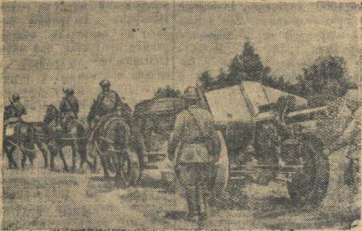
Советские артиллеристы продвигаются на передовые позиции.