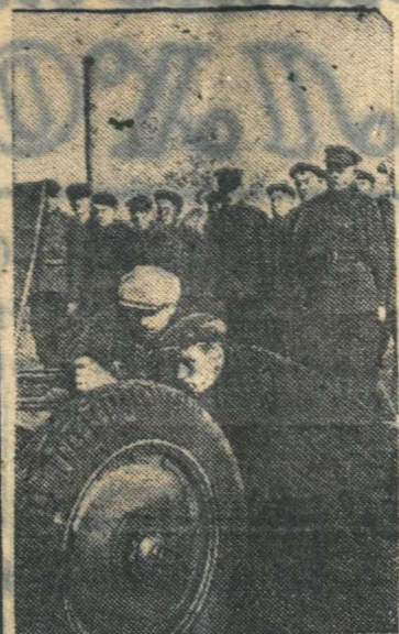
ГЕРОИЧЕСКИЕ ЗАЩИТНИКИ ЛЕНИНГРАДА.

Охваченный пламенем, бомбардировщик рухнул на землю. В этот день фашисты еще четыре раза пытались прорваться к городу, но были отброшены.