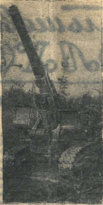
Мощная советская артиллерия на огневой позиции.