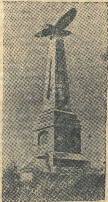
Памятник фельдмаршалу М. И. Кутузову в Бородино на месте великой битвы.

Поразительно, как мало знает фронт о родине. Я пришел к