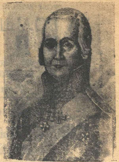
Адмирал Федор Федорович Ушаков. (1743-1817)