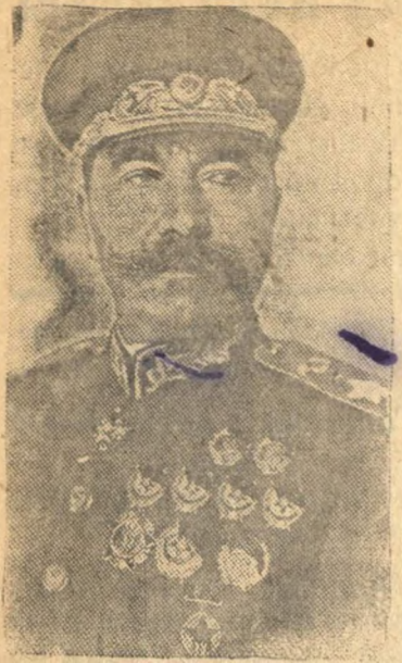
25 апреля 1943 года исполнилось 60 лет со дня рождения С. М. Буденного НА СНИМКЕ: Маршал Советского Союза СЕМЕН МИХАЙЛОВИЧ БУДЕННЫЙ