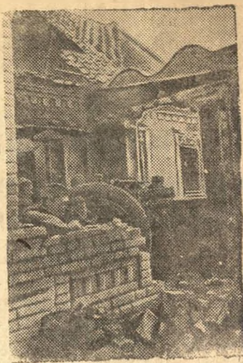
НА СНИМКЕ: Бой на улицах Мелитополя. Орудие бьет прямой наводкой по засевшим в соседних зданиях немцам.

Такое положение нетерпимо. Лесозаготовки—задание фронта и они должны выполняться безоговорочно каждым колхозом, каждым колхозником, по фронтовому. Лес нужен родине и фронту! Надо мобилизовать все силы и внимание на 100 процентное обеспечение высылки в лес рабочей силы, на досрочное выполнение плана лесозаготовок в четвертом квартале. Партийные организации и весь колхозный актив должны стать застрельщиками досрочного выполнения задания родины! Лен.